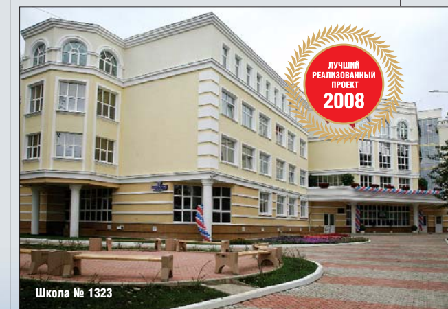
Школа № 1323